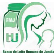
Banco de Leite Humano de Jundiaí

A cidade de Jundiaí, reconhecida como a Cidade das Crianças, destaca-se pelo cuidado desde o início da gestação. O Hospital Universitário, referência em atendimento materno-infantil para a Região Metropolitana de Jundiaí, realiza encontros mensais para gestantes.